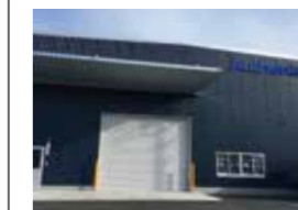
神奈川テクニカルセンター(相模原市緑区)