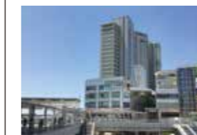
オーセンテック本社(神奈川県相模原市南区)

2017年 AuDeBuCX、AuDeBu1000MPF、 AuDeBu Racoon800、AuDeBu1002 Robot 等をMF-Tokyo2017にて初披露。